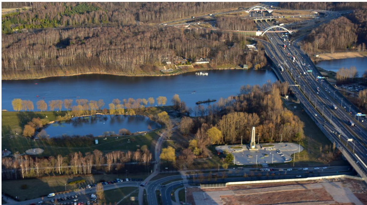
Dolina Trzech Stawów, przecięta ul. Górnośląską (autostrada A4); na drugim planie widoczny węzeł komunikacyjny – skrzyżowanie z drogą 86 (ul. Pszczyńska)