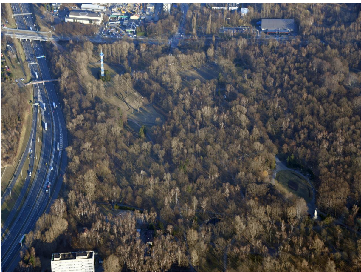
Kompleks parkowy pomiędzy ul. Mikołowską a ulicą Kościuszki, z infrastrukturą rekreacyjną i sportową.