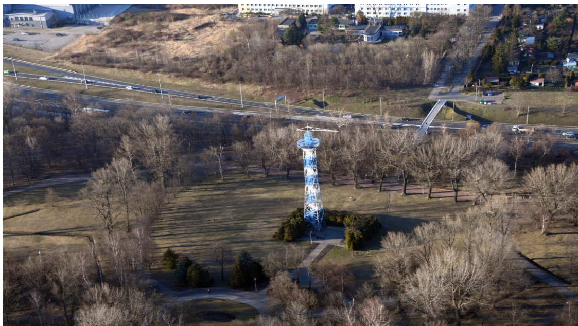
Park Kościuszki w Katowicach, Wieża Spadochronowa