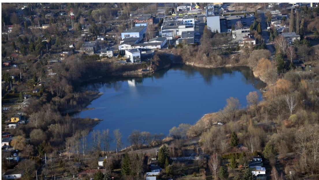
Staw Grunfeld w otoczeniu ogródków działkowych w okolicy ul. Krzemiennej